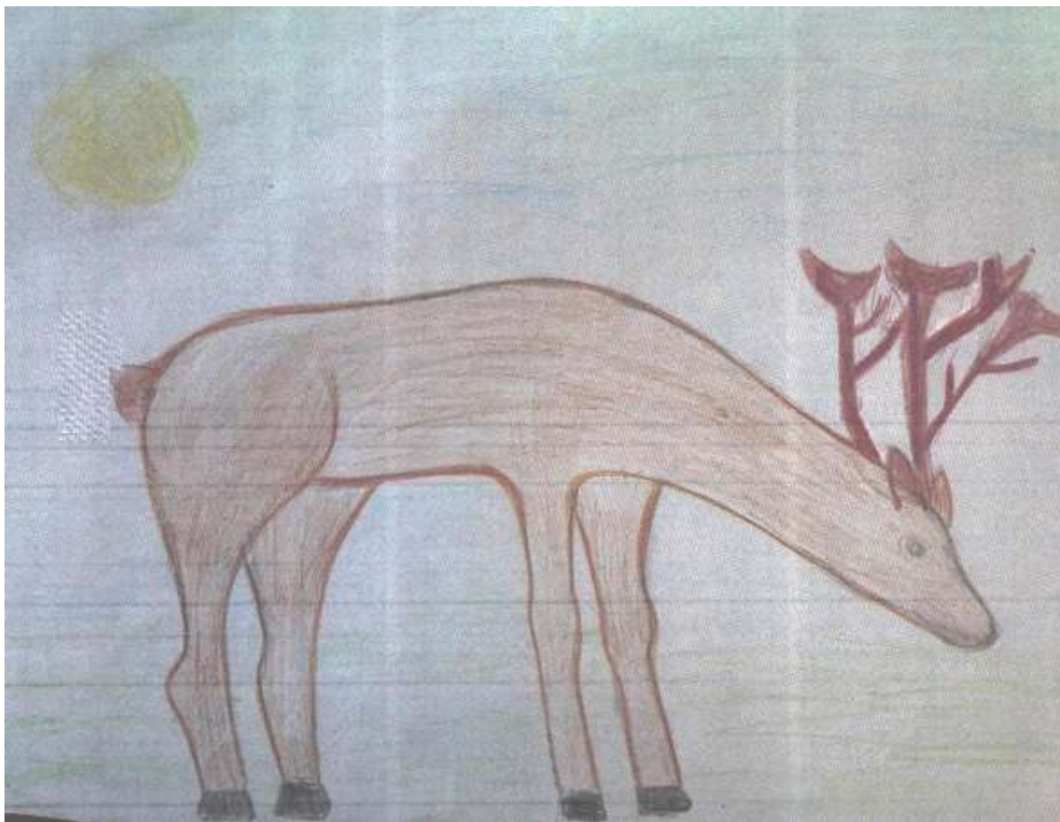
Рис. Роцук Ирины