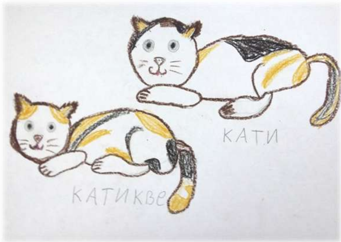
Рис. Ивановой Ренаты