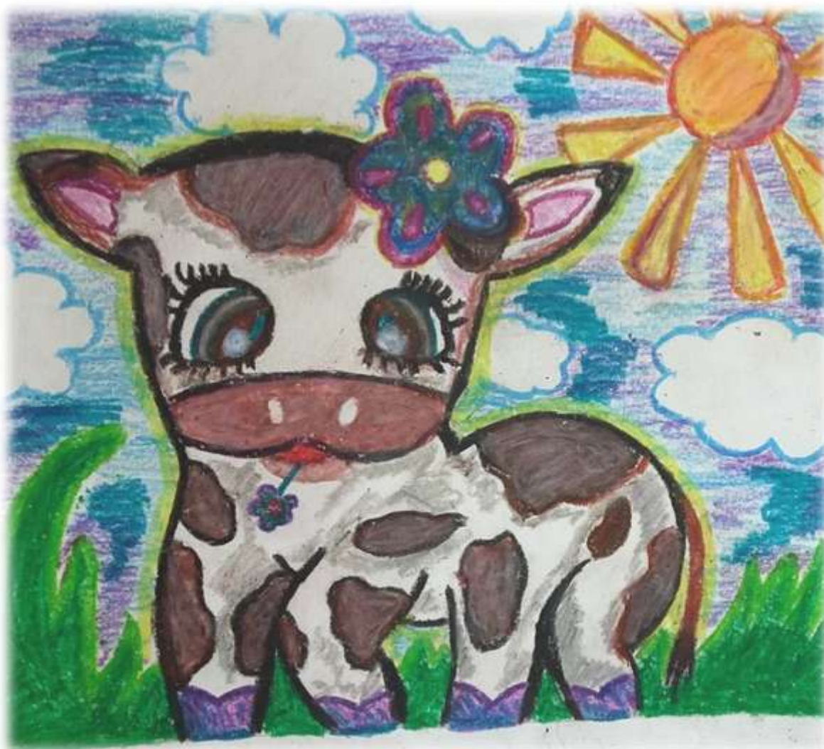
Рис. Коловой Светланы