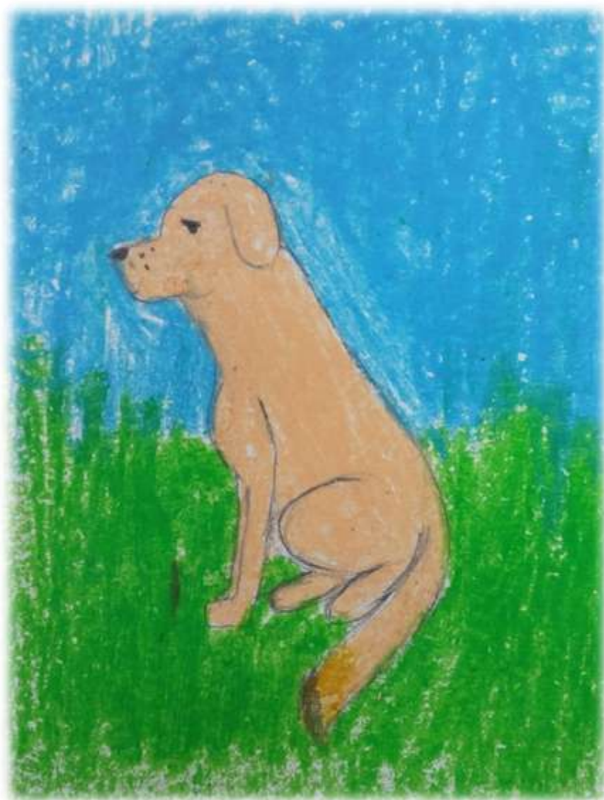
Рис. Норовой Алины